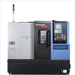
CNC 5호기 1대 보유