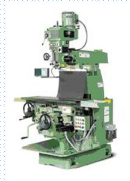
범용 밀링 1대 보유