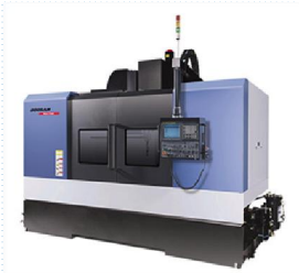
MCT 6호기 3대 보유